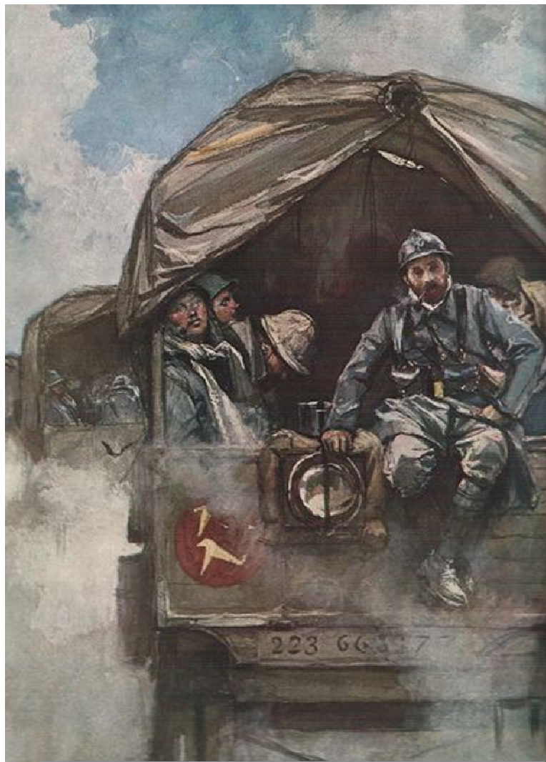
Sur la route de Verdun, la relève - 25 février 1916 Aquarelle de François Flameng

Lettres de Poilus écrites par les élèves de 2EL1